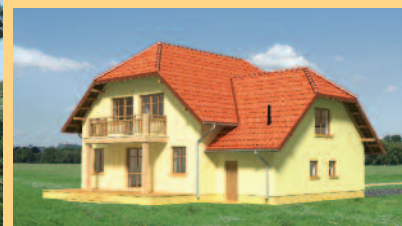
Widok od strony ogrodu