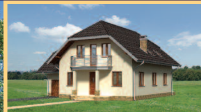
Widok od strony ogrodu