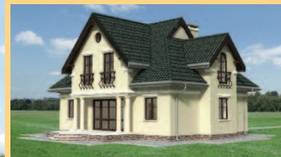
Widok od strony ogrodu