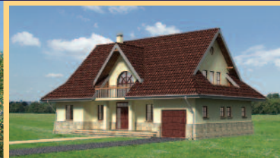
Widok od strony ogrodu