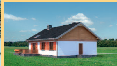
Widok od strony ogrodu