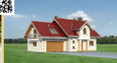
Widok od strony ogrodu