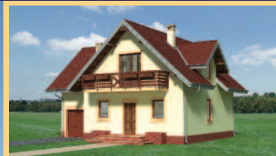
Widok od strony ogrodu